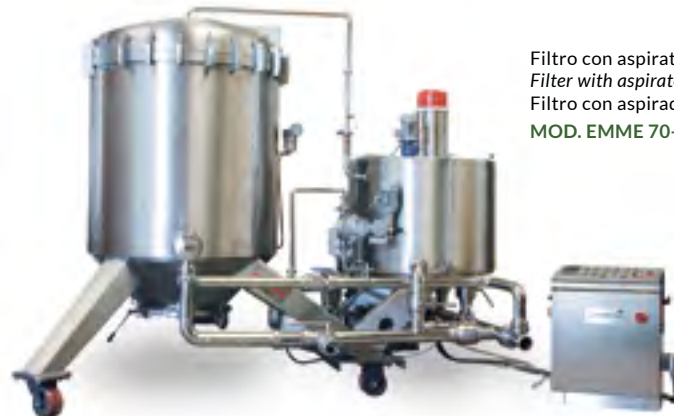
Filtro con aspiratore Filter with aspirator Filtro con aspirador MOD. EMME 70-O