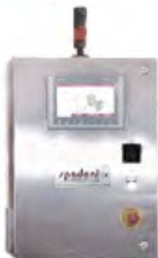
Quadro Touch Screen